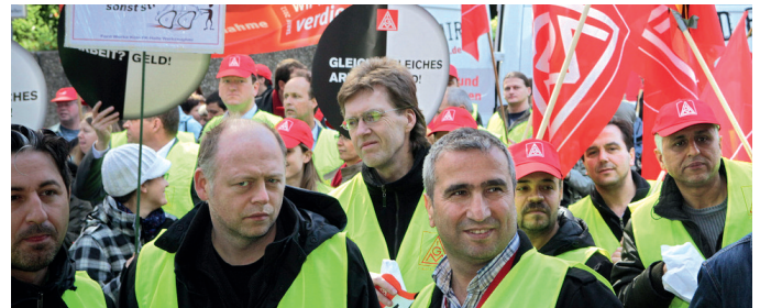
Aktion bei Verhandlung: Für faire Leiharbeit

Nach dem Metall-Tarifvertrag zur Leiharbeit haben Betriebsräte jetzt mehr Rechte in Bezug auf den Einsatz von Leiharbeit. Vor allem haben sie zusätzliche Möglichkeiten, ihre Zustimmung zur Einstellung von Leih-