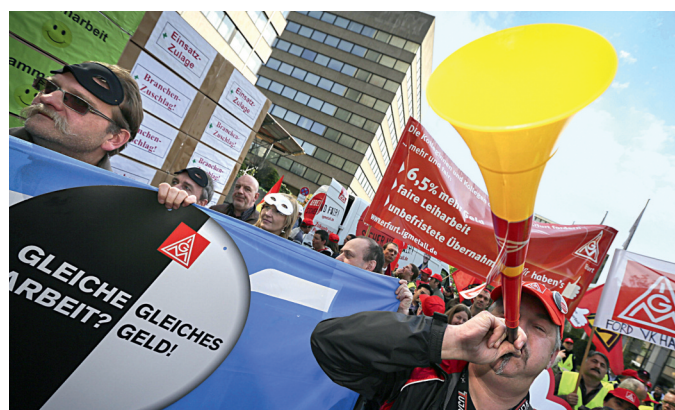
Solidarität: Gemeinsam demonstrieren Leih- und Stammbeschäftigte.

Wie in diesem Fall greifen die in zweigleisigen Verhandlungen erzielten Tarifiergebnisse auch sonst ineinander. Gemeinsam setzen sie dem Missbrauch von Leiharbeit Grenzen. Sie sichern Leihbeschäftigten ein deutlich verbessertes Einkommen und auch verbesserte Perspektiven auf eine Festeinstellung. In der Metallindustrie ist bei der Leiharbeit ein auf Lohndumping basierendes Geschäftsmodell erschwert. Außerdem wird das Ersetzen von Stamm- durch Leihbeschäftigte deutlich schwieriger. Dafür sorgen die erweiterten Mitspracherechte der Betriebs-