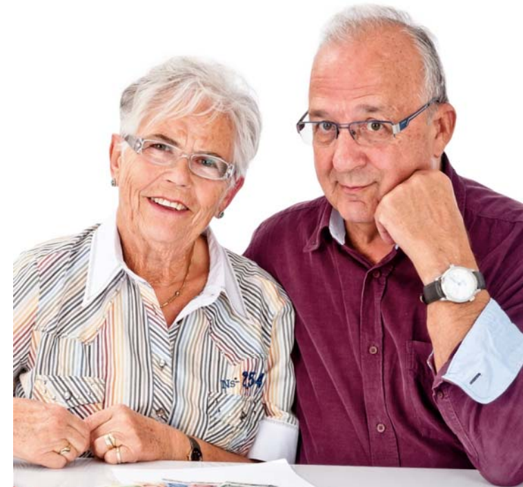
V.i.S.d.P.: Helene Sommer, IG Metall Friedrichshafen-Oberschwaben, Riedleparkstraße 13, 88045 Friedrichshafen